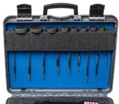
専用ケースにコンパクトに収納