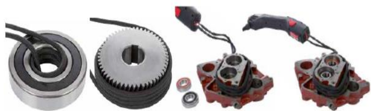
様々な形状のワーク加熱に対応